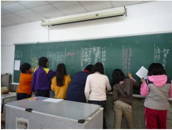
提問的問題琳瑯滿目