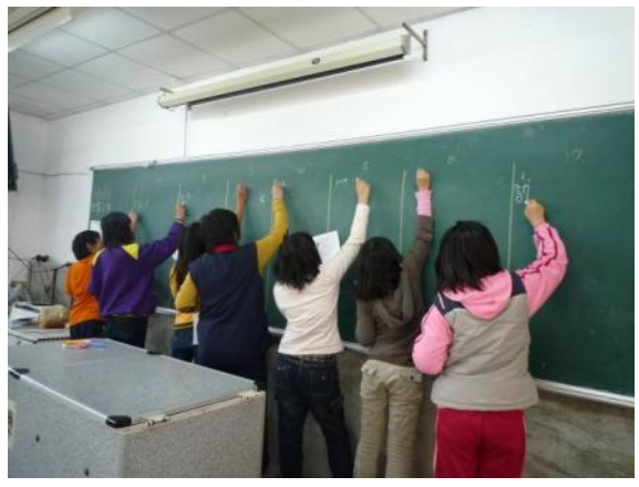
小记者們將問題寫在黑板上