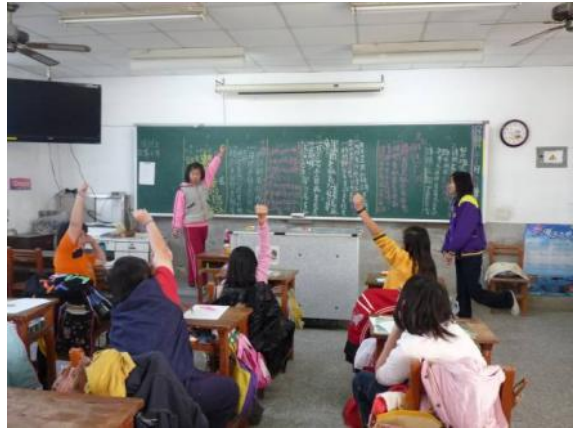
開始票選最佳問題