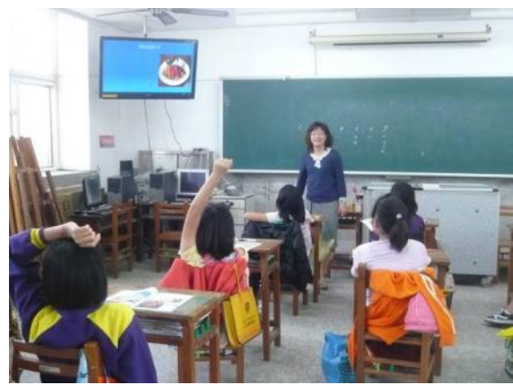
烏魚子如何處理最好吃