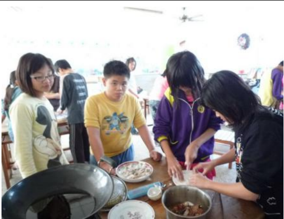
開始裹粉，準備要下鍋油炸囉！