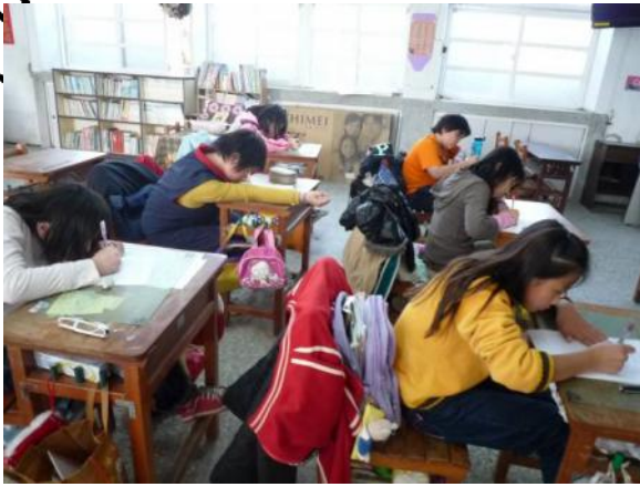
小记者們正絞盡腦汁提問題