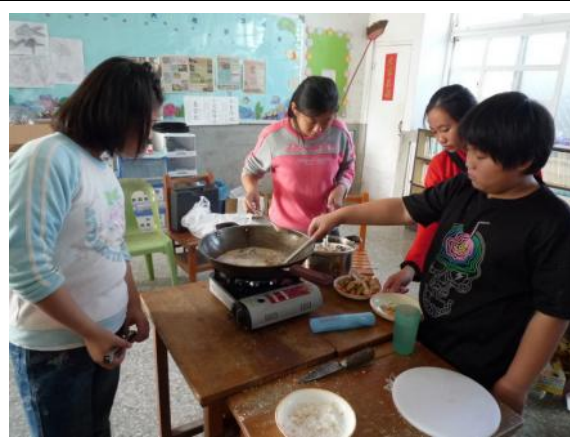
面對沸騰的油鍋，小朋友仍然面不改色，小心的在炸魚條呢！