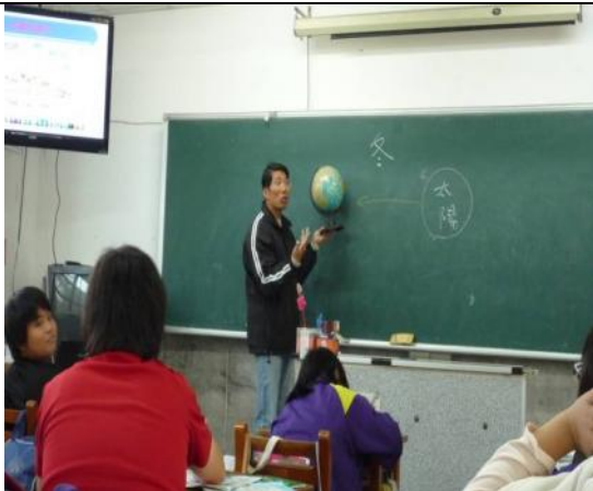
以地球儀說明冬至節令