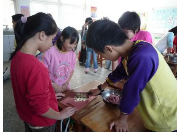
看我的快刀蒜頭手，包準一切蒜頭都溜走！