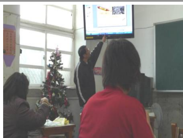
簡報說明烏魚變性