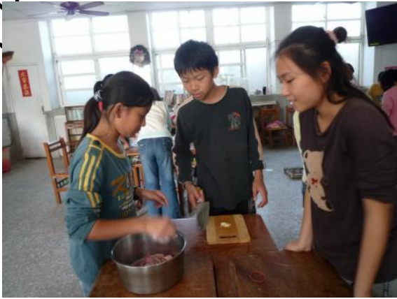
大廚們準備大顯身手囉！