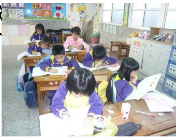
學生認真的進行提早寫作